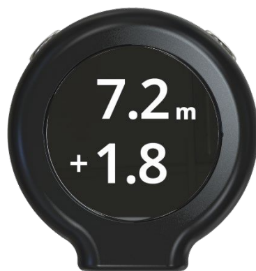
左: パッティングビュー本体 | 右: パッティングビュー表示画面