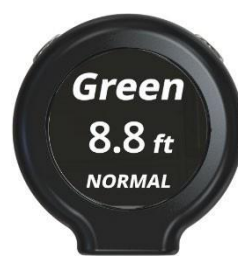
グリーンスピード