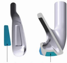
タングステンウエイト 20g

ヘッドスピード 38m/s 以下でもラクにボールをあがりやすくするため、ソールに 20g のタングステンウエイトを装着、さらにワイドソールにすることで低・深重心化を実現。また、ワイドソールでありながら抜けの良さを追求したソール形状で、シビアなライにも対応でき、ミスヒット時でもボールが拾いやすい。