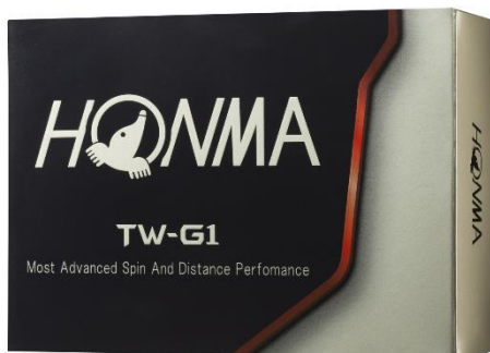
<TOUR WORLD TW-G1>

熱意系ゴルファーの高い要求に応えることをコンセプトとした「TOUR WORLD TW-G1」シリーズは、2014年の発売以来多くの競技志向プレーヤーに愛されてきました。熱意系ゴルファーの多くが求める「飛距離性能」、「ショートゲームにおけるスピン性能」、「コントロール性能」の面において一層の進化を遂げ、NEW『TOUR WORLD TW-G1』『TOUR WORLD TW-G1x』として発売いたします。