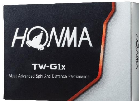
<TOUR WORLD TW-G1x>