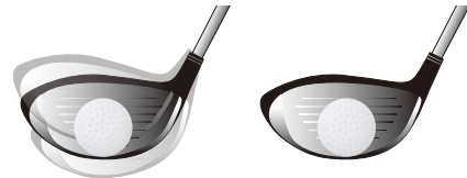
従来の走り系シャフト

HTT (Hard Trajectory Tip) テクノロジーにより、走り系シャフトにありがちな当たり負けやインパクト時のエネルギーロスを解消。走って叩いて飛ばせる、今までにない振り心地をもたらします。