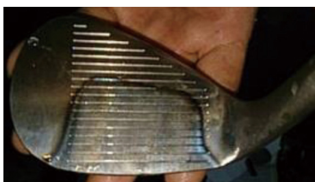
インパクトゾーン全体を Water Quenching 処理

インパクトエリアに水焼入れ処理（Water Quenching 処理）を施すことで柔らかい打感を実現。フェース面はW ヘリンボーンミーリング仕上げでスピン性能の安定化を図っている。