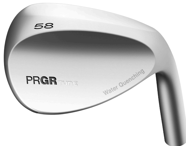
TUNE ウェッジ (58°)

「PRGR TUNE」はゴルフ専門店・工房でのクラブ組立を前提としており、ウェッジヘッドは個体ごとに行うヘッド質量の測定管理と高い調角性で、より細かなクラブ組立にも対応することができる。