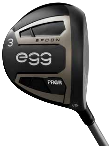
NEW egg フェアウェイウッド (3W)