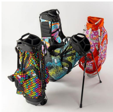
スタンドキャディバッグ YP-001