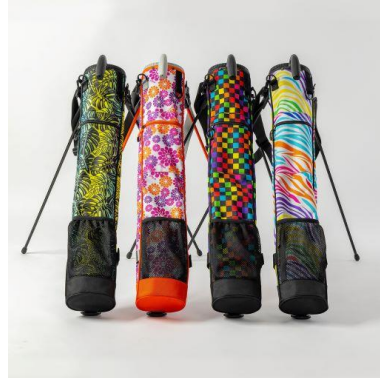
セルフスタンドバッグ YP-301RB