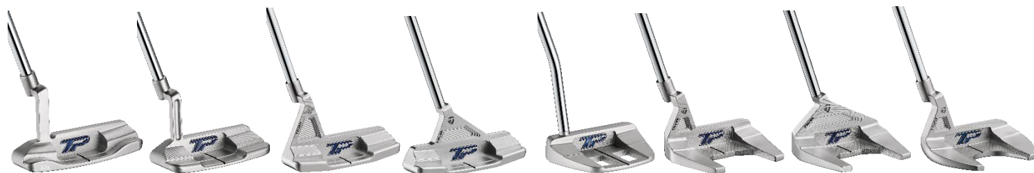
『SOTO』 『DEL MONTE1』 『JUNO』 TB1、TB2 『DUPAGE』 『BANDON』 TM1、TM2 『ARDMORE』

テーラーメイドゴルフ株式会社(本社:東京都江東区/代表取締役社長:マーク・シェルドン・アレン)はこの度、独自に開発した新しい仕上げ方法「ハイドロブラスト製法」により高級感のある光沢仕上げを実現し、303 ステンレススチールの採用でソフトな打感や落ち着いた打音が特長的な、美しさと機能性を併せ持つパターシリーズ『TP COLLECTION HYDRO BLAST (ティーピーコレクション ハイδρο ブラスト)』を2021年6月11日(金)に発売※します