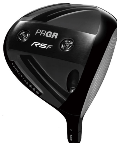
RS F PROTOTYPE ♣♣♣