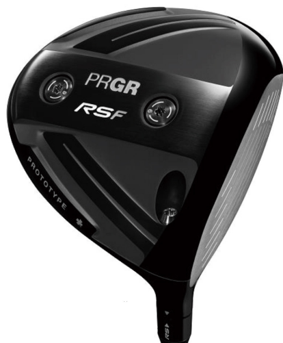
RS F PROTOTYPE ♣

「RS F PROTOTYPE」は、センター後方に重みを感じられる洋ナシ形状の「RS F PROTOTYPE ♣」とヒールバックに重みを感じられる丸型形状の「RS F PROTOTYPE ♣♣♣」をラインアップ。2種類の形状と重心設計でツアープロや上級者が求めるスピンコントロールを実現。微細な重心セッティングができるよう、調整可能なウェイト2つをソールに配置した。さらにギリギリだけじゃない、「快心の一撃性能」をプラスした「RS5」シリーズの「強い芯」と「広い芯」を両立する「W CORE (ダブル・コア) 設計」で高い飛距離性能と上級者の嫌う左のミスを軽減する設計となっている。