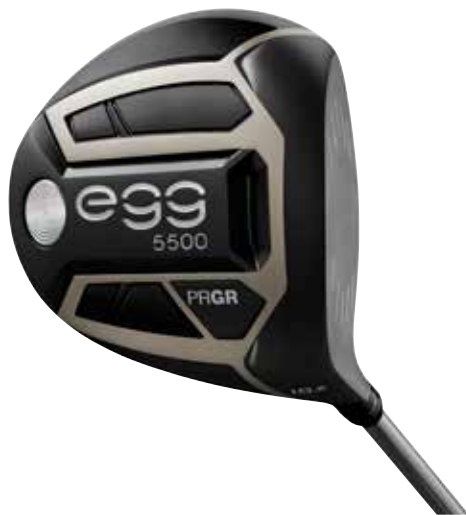
NEW egg 5500 ドライバー

プロギアは同時に発売する「NEW egg フェアウェイウッド」「NEW egg アイアン」「NEW egg FORGED (フォージド) アイアン」「NEW egg i+ (アイ・プラス)」の新しい egg で飛び、やさしさを求めるゴルファーの限界を突破していく。