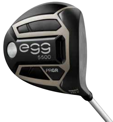
NEW egg 5500 ドライバー impact