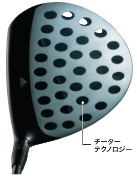
チーターテクノロジー

軽量クラブのメリットである軽快な振り抜きと加速感をキープしたまま、高慣性モーメントヘッドの特徴である、ボールを力強く押し抜いていくパワーをプラス。これまでにないインパクトエネルギーをボールに伝えることで、大きな飛距離へと導きます。