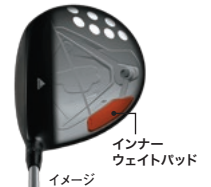
インナーウェイトパッド イメージ

理想的な重量配分にするため、トゥ側の重量を削減。ヒール側に約12gの肉厚インナーウェイトパッドを配置することで、低・深重心構造と慣性モーメント値の最大化を可能にしました。