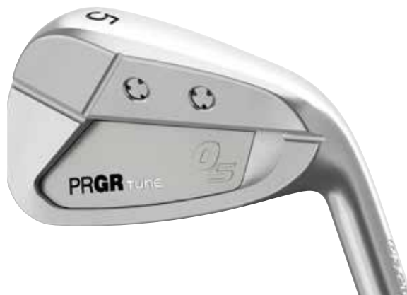
TUNE 05CB アイアン (#5)

「PRGR TUNE」はゴルフ専門店・工房でのクラブ組立を前提としており、ヘッド質量を1グラム単位で管理する高精度質量管理を行うことで、より細かな調整にも対応することができる。