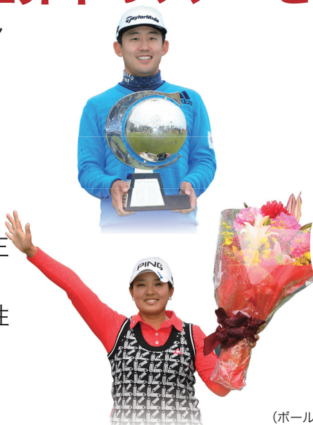
2017 世界ツアー使用数