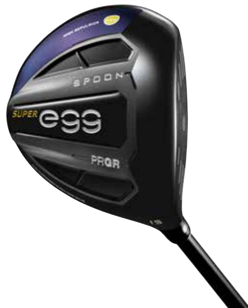
NEW SUPER egg フェアウェイウッド (3W)