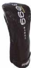
専用ヘッドカバー