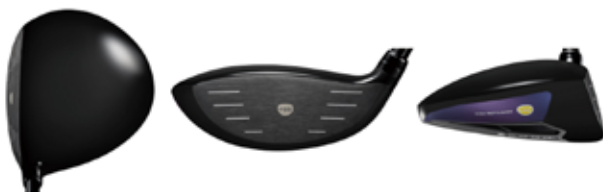
« SUPER egg ヘッドサイズ 新旧比較表 »