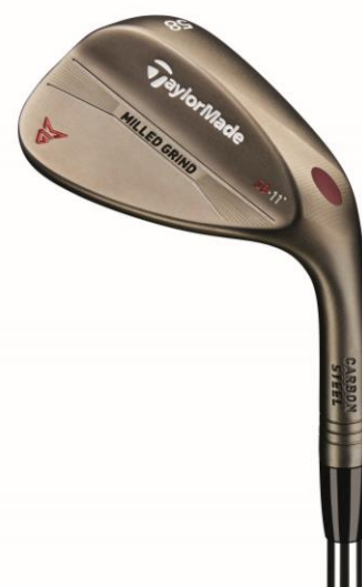
『MILLED GRIND WEDGE BRONZE』 2017 年 10 月上旬より受付開始