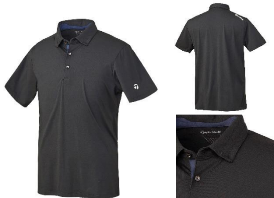
【Men's】「テイラード ライトウエイトS/Sポロ」

サイズ : S/M/L/O/XO 価格 : ¥14,000 (税別) カラー : ブラック/ネイビー/ミント/ ブルー/ライム/ホワイト